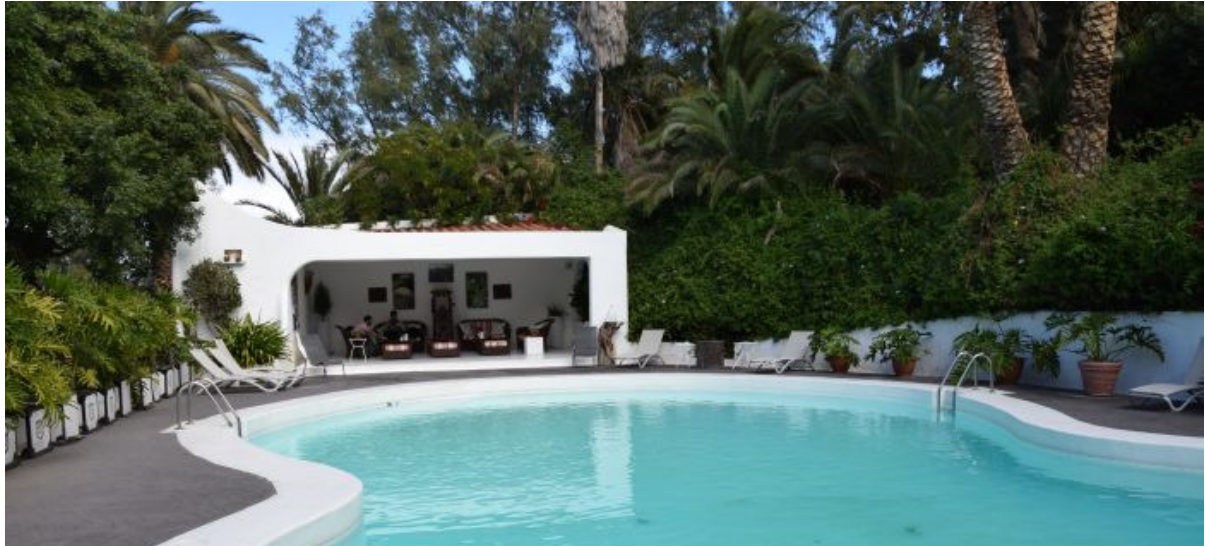
Der Poolbereich liegt ruhig im Garten.