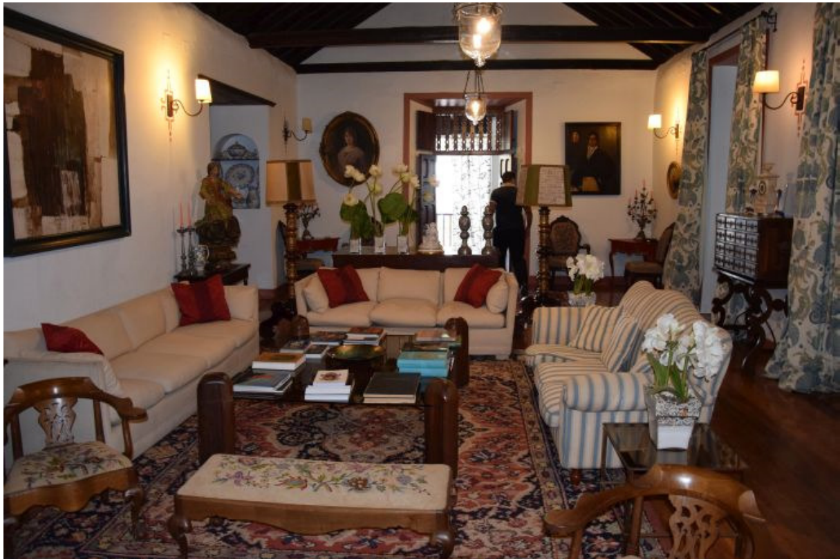
Ähnlich wie die Aufenthaltsräume sind die Zimmer gestaltet.